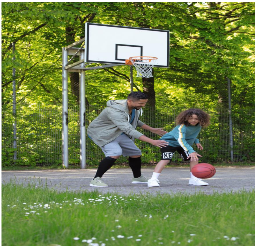
Voorbeeld van een steunkous