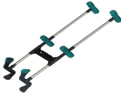
Handlegs voor beenkousen