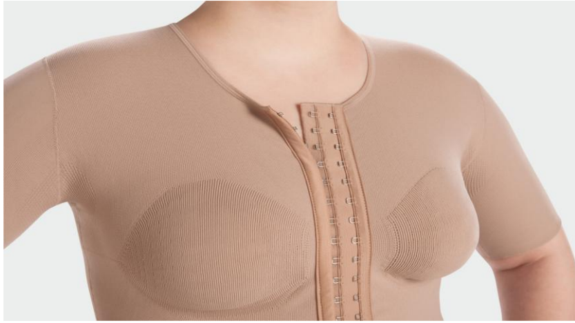
Voorbeeld van een drukhemd