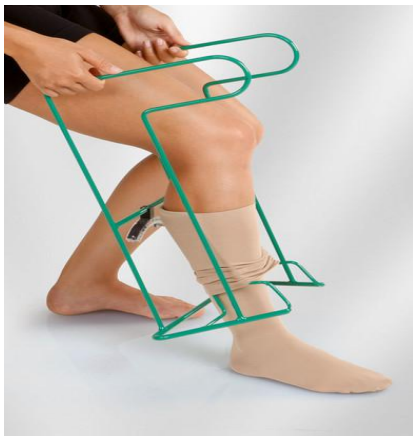
Juzo Easy Fit, aan- uittrekhulp