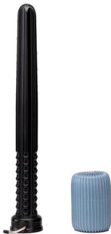
bron Foto: www.Proflebo , Doff en Donner aan- uittrekhulp