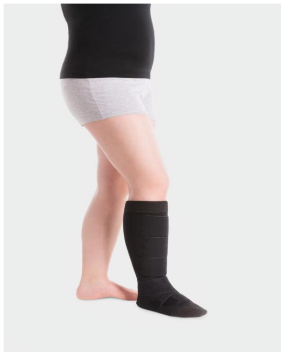
Voorbeeld van een klittenbandverband