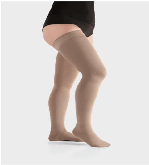
Voorbeeld van een Steunkous